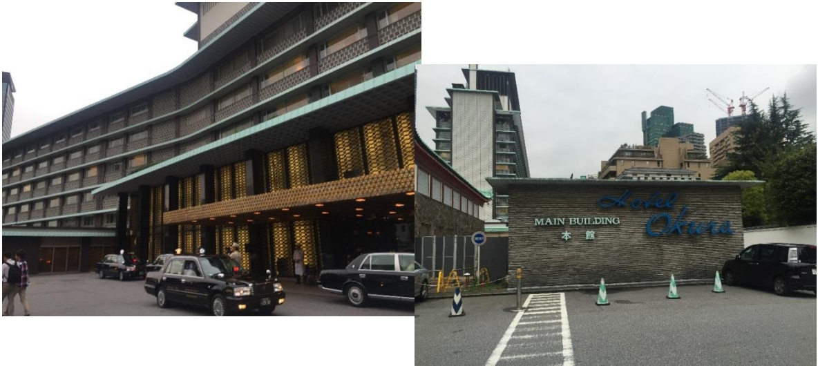
ホテルオークラ東京 本館営業最終日の姿